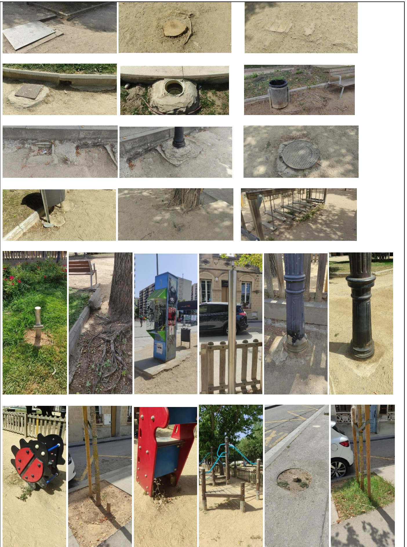
Aquesta proposta ha estat presentada inicialment a través de la Plataforma